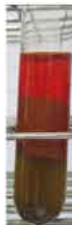
Figura 2.- Obtención de aceite de hígado de pota ( Dosi-dicus gigas ) luego de la centrifugación de las muestras tratadas.

En las Tablas 2 y 3, se aprecia que el contenido de colesterol y de lípidos insaponificables en los aceites extraídos fue de aproximadamente 3,5% y 5,2% respectivamente, no habiéndose registrado diferencias significativas entre los tratamientos, durante los diferentes procesos de extracción. El color de los aceites fue rojo-naranja translúcido, debido probablemente al gran contenido de carotenoides, entre ellos la vitamina A y astaxeno (BRACHI 1952, FISHER et al. 1956) con valores de 17 en la escala de color Gardner (Figura 2).